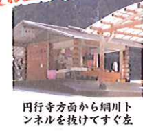
円行寺方面から網川トンネルを抜けてすぐ左